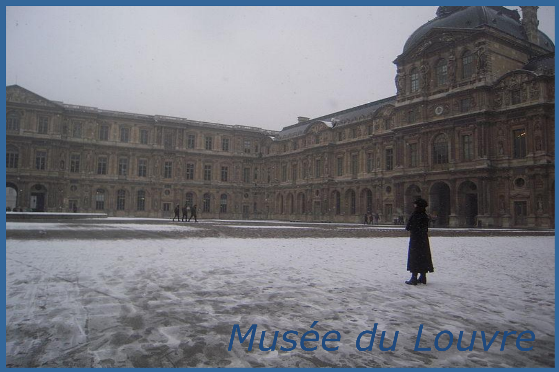
Musée du Louvre